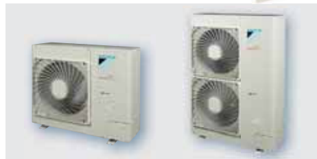
Venkovní jednotky RZQG71L7V1/LY1 RZQG100,125L7V1/LY1

DAIKIN AIRCONDITIONING CENTRAL EUROPE - CZECH REPUBLIC SPOL. S R.O.